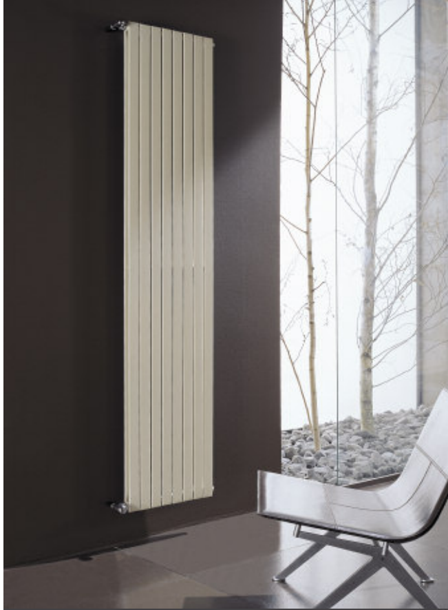
In fotografie: Calorifer Piano 2 Verticală. Înălțime mm 2020, 8 elemente, culoare Ivory (cod. 02).

CALORIFERUL PIANO2 POATE FI INSTALAT ATĂT VERTICAL CĂT ȘI ORIZONTAL